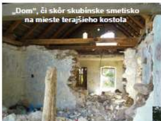
„Dom“, či skôr skubínske smetisko na mieste terajšieho kostola

„Ideme stavať!“, padlo uvážené vážne rozhodnutie. Chceme, aby poštár zvonil na náš vlastný zvonček a aj kňazovi treba útulnú „komôrku“. Začali sme hľadať pozemok a vytypovali sme si dve lokality na výstavbu. Zvo-