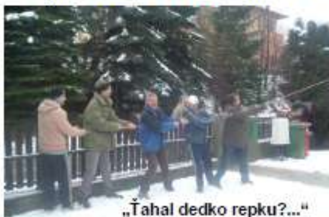
„Ťahal dedko repku?...“