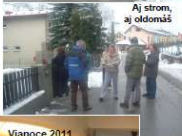
Aj strom, aj oldomáš