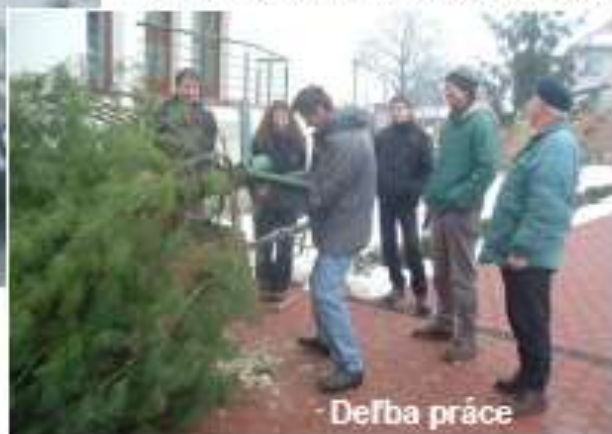
- Delba práce