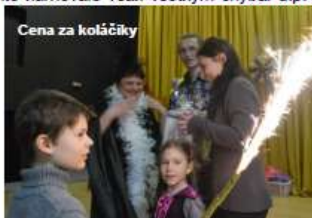
Cena za koláčiky