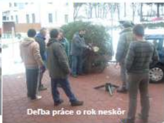
Deľba práce o rok neskôr