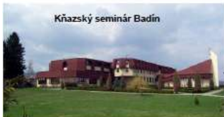
Kňazský seminár Badín

Práca ekonóma v seminári snáď ani nie. Bola to rutinná práca. Ale duchovný život v seminári, s ktorým som sa stretol určite. V tom čase sa začala v našom seminári diaľková forma štúdia teológie a ja so veľmi túžil vedieť viac. Veď som poriadne nepoznal ani katechizmus. A náboženské vedomosti počas socializmu dosť vybledli. Tak som sa prihlásil na diaľkovú formu teológie. Prijímacie skúšky som urobil na moje prekvapenie veľmi