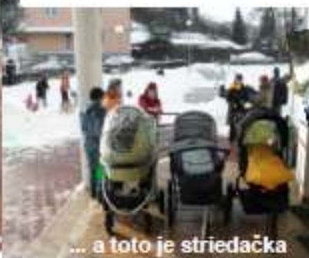
... a toto je striedačka