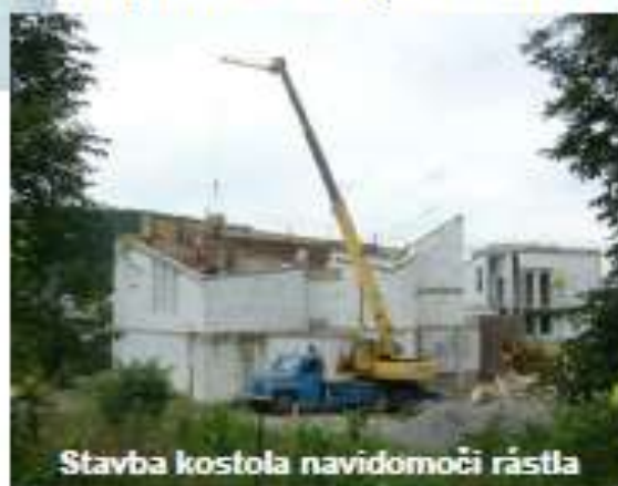
Stavba kostola navidomoči rástla