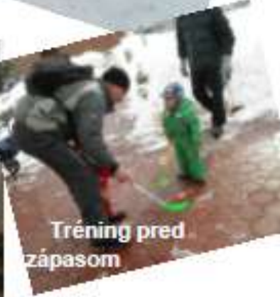
Tréning pred zápasom