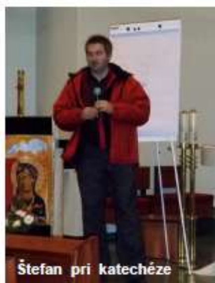
Štefan pri katechéze