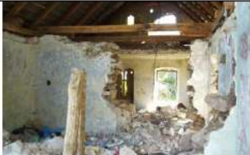
Výstavba kostola 2006 – 2007