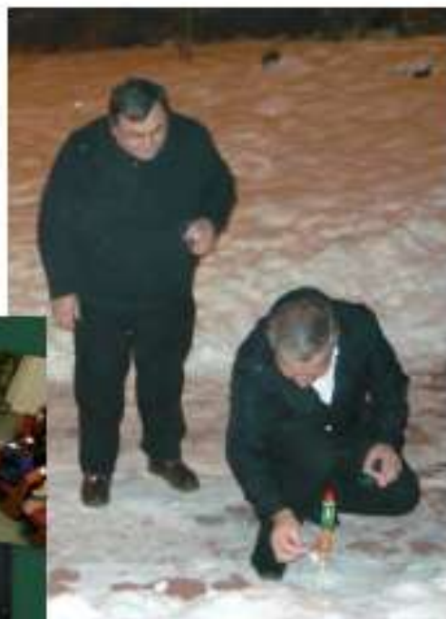
Dvaja „pyrotechnici“, záchranár bol nablízku