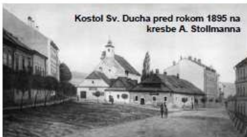
Kostol Sv. Ducha pred rokom 1895 na kresbe A. Stollmanna

Kostol, či skôr malý kostolík Sv. Ducha stál len niekoľko metrov od mestských hradieb. Svojou veľkosťou a dispozíciou by sme ho mohli prirovnať ku kostolu sv. Alžbety v Dolnej ulici, od ktorého bol len o málo väč-